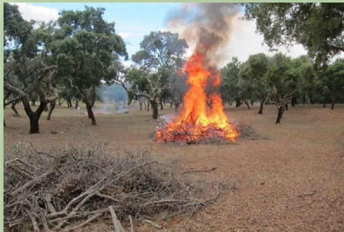
QUEIMA DE SOBANTES AGRICOLAS

https://fogos.icnf.pt/queimasqueimadas/login.asp ou ligar para 808 200 520 .