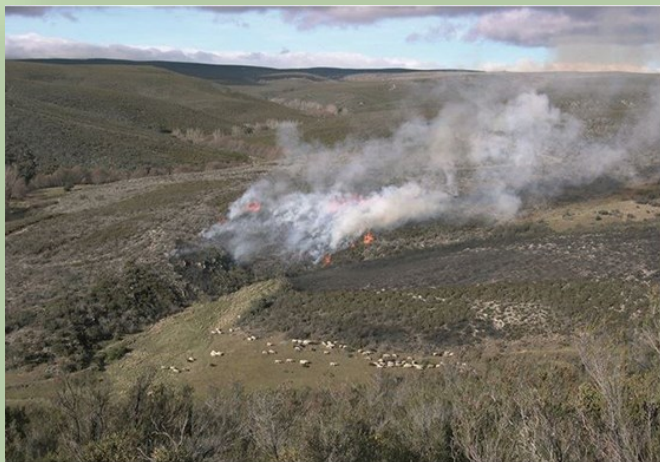
QUEIMADA PARA RENOVAÇÃO DE PASTAGENS

A infração a estas regras constitui contraordenação.