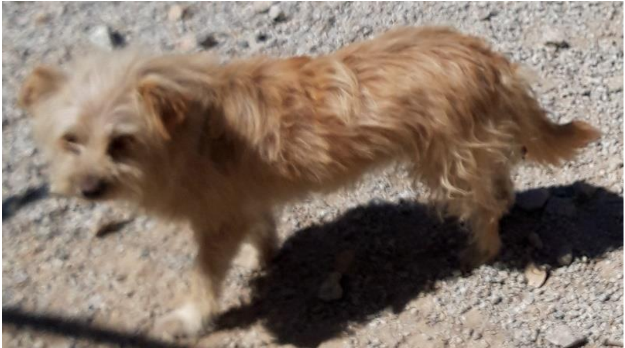
1 canídeo macho com cerca de 2 meses de idade